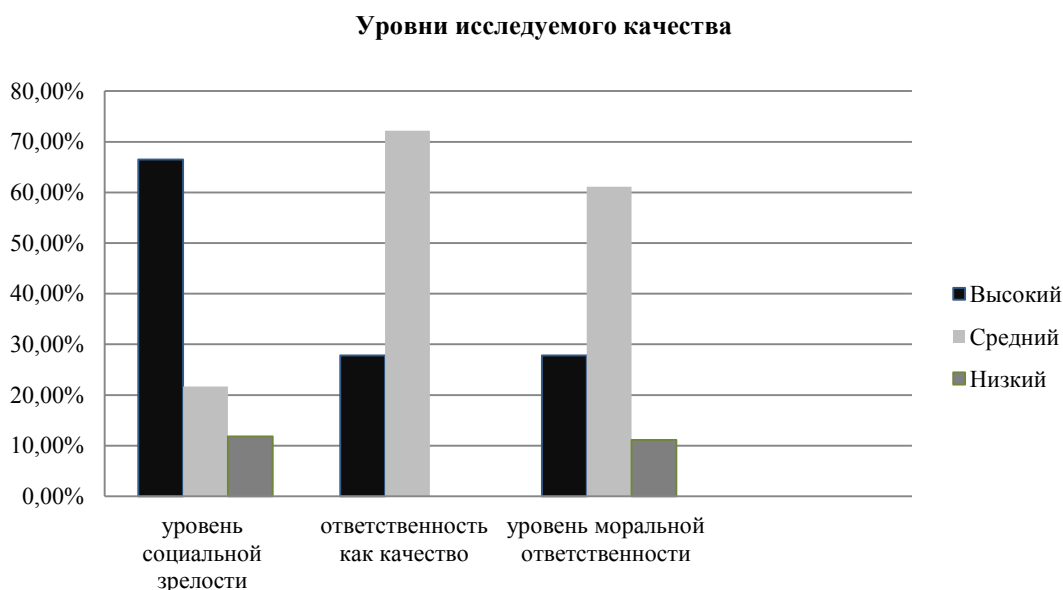
Рисунок 2. Результаты контрольного этапа эксперимента

Диагностика морально-этической ответственности личности с помощью опросника ДУМЭОЛП показала, что наблюдается рост количества респондентов с высоким уровнем морально-этической ответственности (на 5,6%), со средним уровнем морально-этической ответственности (на 5,5%), сокращение количества респондентов с низким уровнем морально-этической ответственности (на 11,1%) (см. Рис. 2).