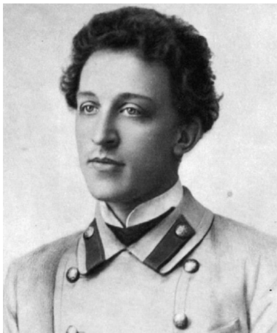
Александр Александрович Блок 1880-1921 гг.