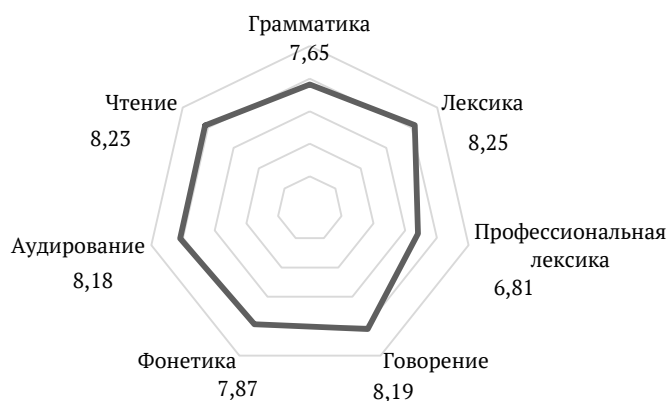
Диаграмма 2. Результаты освоения программы обучения взрослых иностранному языку в баллах (от 1 до 10)