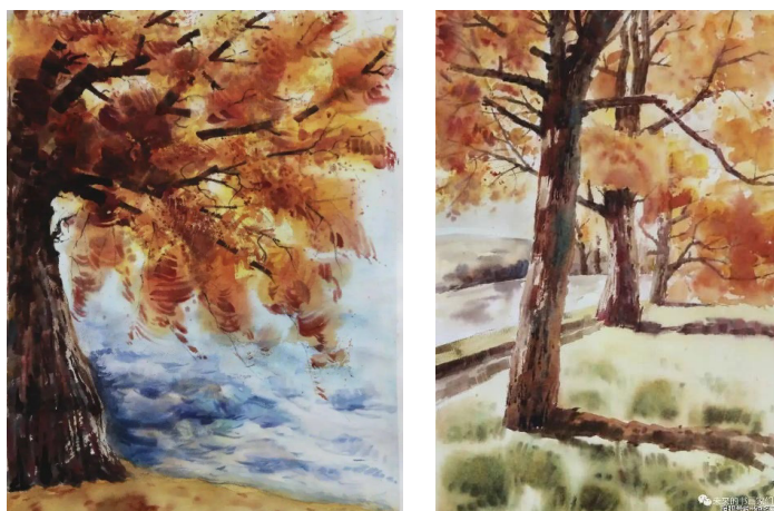
Рисунки 8, 9. Работы студентов, созданные в рамках модуля «Основная техника» в 2020-х гг. и связанные с исследованиями мотивов и приемов в творчестве И. И. Шишкина

1. Практика использования света и тени при создании пейзажных композиций на основе знакомства с приемами русской художественной школы. Например, студенты могут повторить и творчески переработать особенности создания световых и теневых слоев при изображении морской поверхности в картине И. К. Айвазовского «Девятый вал» в световые и цветовые ритмы, с разницей температур, при передаче образов пустыни Гоби на рассвете и/или закате. Также анализ полотен А. И. Куинджи может помочь при изучении и передаче световоздушной перспективы, ее влияния на тоновые соотношения и оттенки при цветопередаче, а также контрастов и мотивов, ракурсов для изображения заснеженных вершинах гор Тянь-Шаня (Рисунки 6,7).