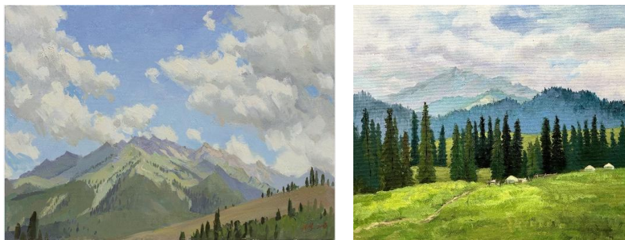
Рисунки 6, 7. Работы студентов, созданные в рамках модуля «Специальная подготовка» в 2020-х гг. и связанные с исследованиями мотивов и приемов в творчестве А. И. Куинджи

В перспективе в вузе может быть создан и внедрен вариативный модуль сравнительного изучения классической русской пейзажной живописи и реальных видов Синьцзяна для выявления различий в региональных характеристиках.