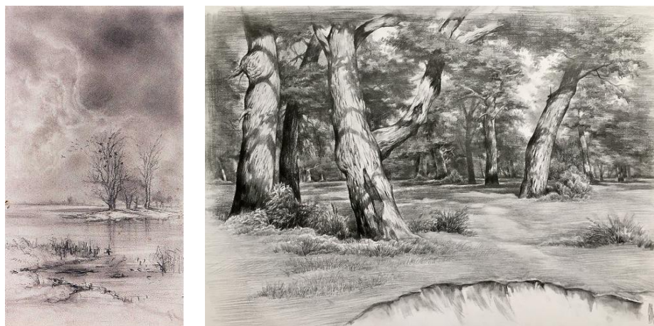
Рисунки 2, 3. Работы студентов, созданные в рамках модуля «Основная техника» в 2020-х гг. и связанные с исследованиями светотеневой моделировки в творчестве российских пейзажистов – А. К. Саврасова и И. И. Шишкина соответственно

Подобное влияние в основном проявляется в интеграции техник и практических приемов на уровне преподавания. На уровне модуля «Основная техника» педагоги знакомят студентов с работами российских пейзажистов. В качестве образцов и примеров точного воспроизведения естественного света и тени, характерных для русской пейзажной живописи, демонстрируются произведения И. К. Айвазовского, А. К. Саврасова и И. И. Шишкина. После этого обучающиеся выполняют задание, требующее создания ощущения пространственной глубины посредством контрастных сочетаний, крупных планов (Рисунки 2, 3).